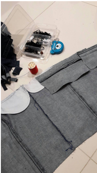
ภาพ 3.2 เย็บขึ้นส่วนต่างๆเข้าด้วยกัน เพื่อที่จะขึ้นรูปกระเป๋า