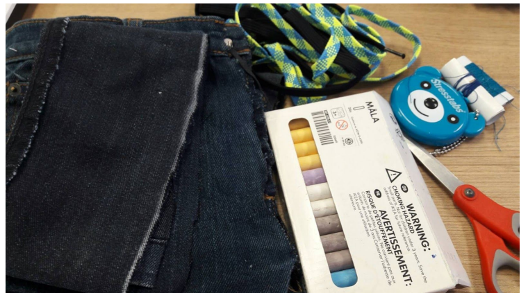
ภาพที่ 3.1 อุปกรณ์ที่ใช้ในการทำกระเป๋าจากกางเกงยีนส์